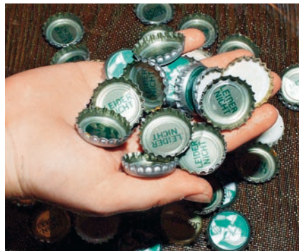
„BEUTE“ EINES TAUSCHGANGS IM JAHR 2000 Der TV-Sender CBS fand nur Kronenkorken einer Stammtischrunde.