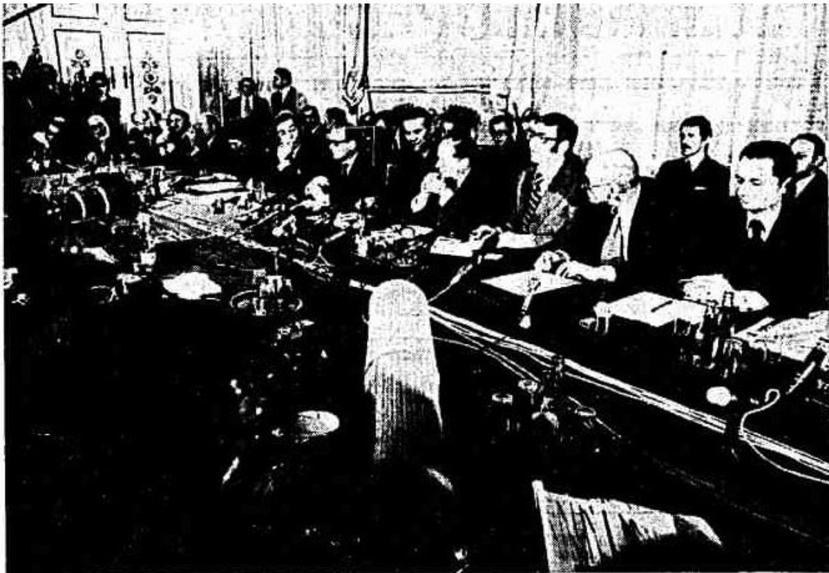
Riesenandrang in- und ausländischer Journalisten und Kameraleute bei Kreiskys Pressekonferenz am Montag