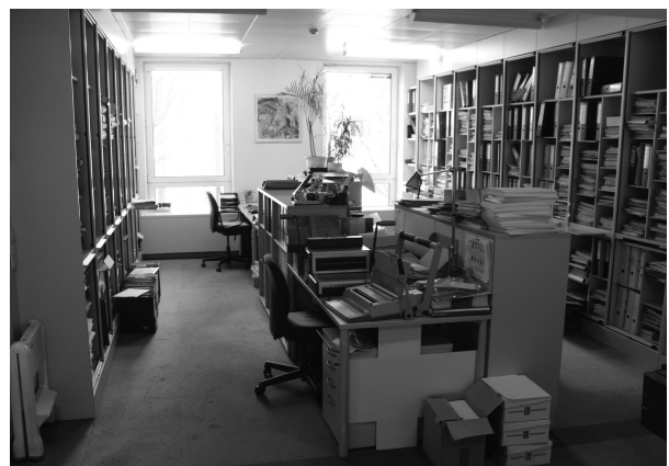
Der Konferenzsaal ist heute Archivraum einer Rechtsanwaltskanzlei.

Ihm selbst wurde der Mord wegen unzureichender Beweislage nicht angelastet, „weil kein Zeuge mit unmittelbaren Wahrnehmungen zur Schussabgabe zur Verfügung stand“. 111