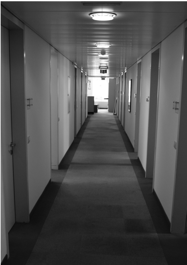
Der lange Flur zwischen Empfangsbereich und Konferenzsaal.