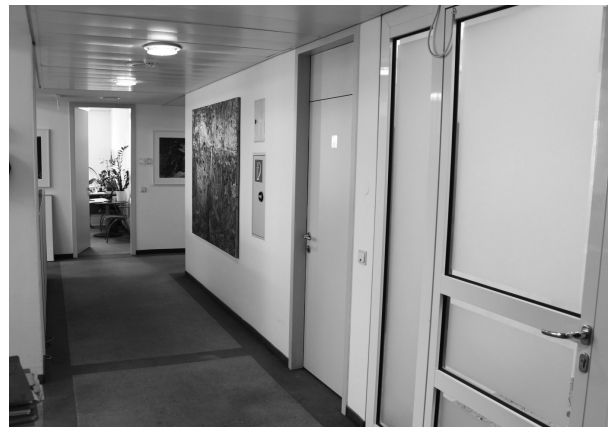
Ehemaliger Empfangsbereich und Ort der Schießerei zwischen Terroristen und Polizei.