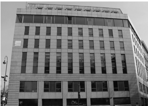
Der ehemalige Sitz des OPEC-Generalsekretariats in Wien heute.

tionsstrukturen – eine allfällige Weitergabe an die DDR-Staatssicherheit hätte schwerwiegende Konsequenzen gehabt, denn Letztere arbeitete mit der libyschen Seite eng zusammen. Erkannte Terroristen hätten gewarnt oder laufende Ermittlungen vereitelt werden können. 89 Ob die Geiselnnehmer 1975 über östliche Geheimdienstkanäle Informationen zu den Sicherheitsvorkehrungen bekamen, die ursprünglich von Hochenbichler stammten, ist Spekulation. Wahrscheinlicher ist, dass diese Hinweise wie beschrieben aus libyschen Kreisen stammten.