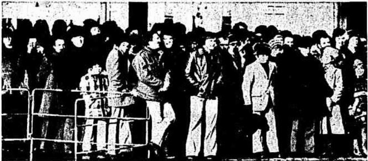
Beim Schottentor drängten sich die Neugierigen, sie brachten sich selber und andere in Gefahr

Bei einer anderen Absperrung bei der Mülkerbastei schwang ein weißhaariger Mann große Reden: „Geht’s loßts mi durch, damit endlich a Ruah is. I wor bei de Husarn. I weiß, wie mas mocht.“ 122