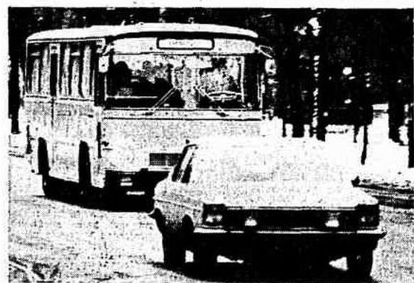
Voran das Auto des Innenministers: Der Autobus auf dem Weg

Transport von Terroristen und Geiseln zum Flughafen.