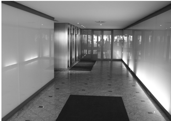
Heutige Ansicht des Foyers. Hier hielten sich Sicherheitskräfte und Unterhändler während der Geiselnahme auf.

von Vorraum, Empfangsbereich und Büroräumen überließen sie den übrigen Kommandomitgliedern. 99