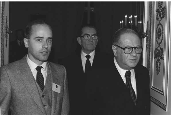
Bundeskanzler Bruno Kreisky (rechts).

(IPC), darunter Matti Peled, Arje Eliav und Uri Avnery. 128 Weiters sorgte er für die Vernetzung von PLO-Repräsentanten mit Entscheidungsträgern der SI und trachtete danach, Arafat „salonfähig“ zu machen. Höhepunkt dieser Bemühungen war der Empfang des PLO-Vorsitzenden im Beisein von SI-Präsident Willy Brandt am 8. Juli 1979 in Wien. 129 „Von diesem Tag an“, so Abdallah Frangi rückblickend, „bröckelte die europäische Ablehnungsfront gegen Arafat. Dass ein Willy Brandt und ein Bruno Kreisky sich nicht scheuten, mit Arafat zu reden, war für ihn die beste Visitenkarte. Vom Prestigegewinn abgesehen sprang bei den Wiener Gesprächen für die Fatah die konsultative Mitgliedschaft in der Sozialistischen Internationale heraus [...]“. 130