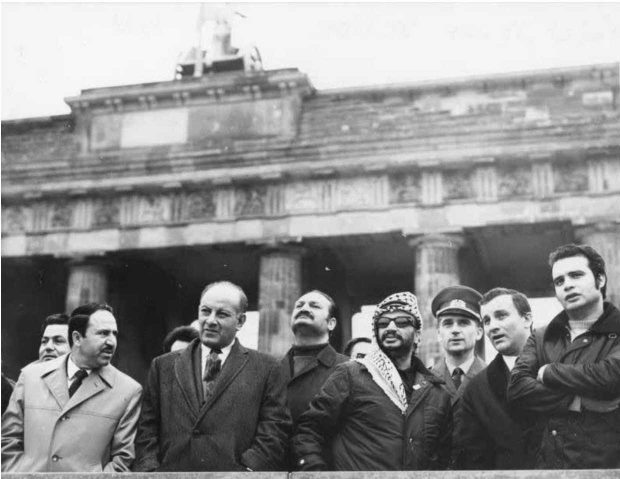
Bundesarchiv, Bild 183-K1102-032 Foto: Franke, Klaus | 2. November 1971

in der Vergangenheit für die Organisation „schwerwiegender Terroranschläge“ wie des Münchner Olympiaattentats verantwortlich gemacht worden: „Er nimmt offensichtlich eine Schlüsselstellung bei der Koordinierung von weltweiten Aktionen der palästinensischen Befreiungsbewegung ein. Sein Auftauchen signalisiert erfahrungsgemäß bevorstehende Aktionen größeren Ausmaßes.“ 94