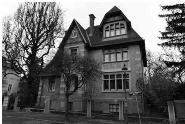
Ab 1981 befand sich die Residenz des PLO-Botschafters in der Wambachergasse, Wien-Hietzing.