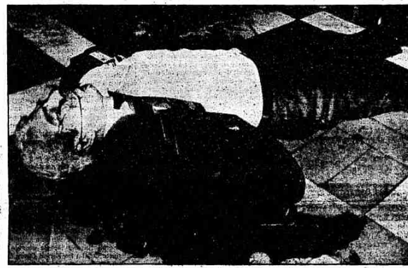
Von mehreren Schüssen aus nächster Nähe in Kopf und Brust getroffen, brach das Opfer tot zusammen.