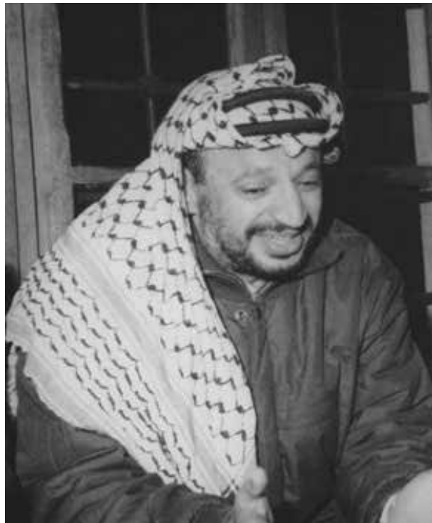
PLO-Vorsitzender Jassir Arafat, 1974.