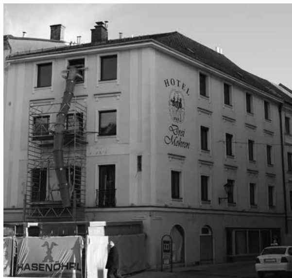
Ehemaliges Hotel „Drei Mohren“ in Linz (2010 geschlossen).

April 1979 um ca. 9.45 Uhr aus Mailand mit der Bahn in Wien angekommen zu sein und dort im Hotel „Kongreß“ Quartier bezogen zu haben. Am Abend des Anschlags habe er eine in der Nähe gelegene Gaststätte besucht sowie gegen 19 Uhr einen „Night Club“. Dort sei er dann bis ca. 3.30 Uhr geblieben. Drei Flaschen Sekt habe er konsumiert und die Zeche habe „800.- Dollar und 2000.- Schillinge“ betragen – die beiden anwesenden Damen hätten ihn unter dem Namen „George der Grieche“ gekannt und extra für ihn eine Kassette mit griechischer Musik abgespielt. Den Einwand des Vernehmers, dass diese Angaben „kein stichhaltiges Alibi“ enthalten würden, quittierte Hamade folgendermaßen: „Ich kann nichts anderes angeben, ich habe mit dieser Sache nichts zu tun.“ 30 Sejaan wiederum gab an, „entweder am 22. oder am 23.4.1979“ spätnachmittags in Wien eingetroffen zu sein: „Mit einem Taxi fuhr ich zum Hilton-Hotel und ich habe eine Nacht dort verbracht. Ich war alleine und hatte keinen Begleiter bei mir.“ 31 Er behauptete, Hamade erst am Bahnhof Linz kennengelernt zu haben und zwar „als griechischen Zyprioten, der sich mir gegenüber lediglich mit dem Namen George vorstellte“. Er habe den Mann loswerden wollen, „weil er mir nicht so gut gefiel. George schien mir unsympathisch und mich störte sein Mundgeruch“. Aber weil er ihm schon eine Mitfahrgelegenheit zugesagt hatte, nahm er ihn anderntags im Leihwagen nach Passau mit. 32