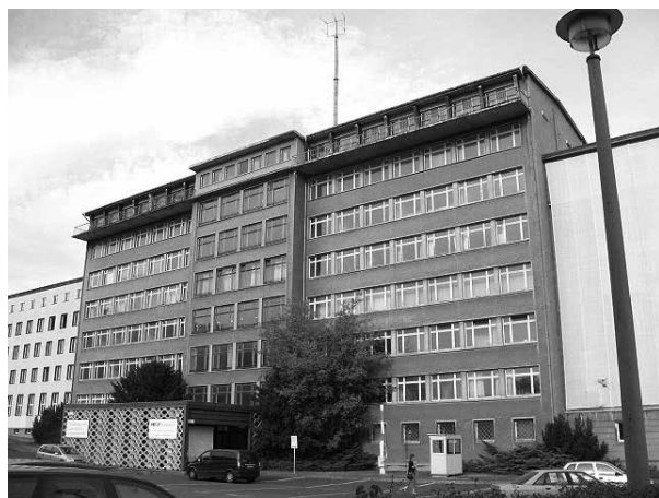
Ehemalige Ost-Berliner Zentrale des DDR-Ministeriums für Staatssicherheit.

Staatsanwaltschaft Wien im April 1980 Anträge beim Landesgericht Wien, Hamade und Sejaan im Inland zur Aufenthaltsermittlung auszuschreiben bzw. das Verfahren bis zu deren Ausforschung abzubrechen. 88