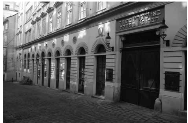
Das Ziel des Anschlags: Stadttempel Wien.

hörden: „Ich kann überhaupt nicht sagen, warum ich zu dieser Sachlage befragt werde, interessiere mich für diese Dinge nicht und weiß auch nicht, wer als Täter für den Sprengstoffanschlag in Frage kommen könnte. [...] Ich bin bestrebt, mich an die Gesetze meines Gastlandes zu halten.“ 13 Die Erhebungen in rechtsextremistischen Kreisen brachten nur zutage, dass einige Neonazis in der Nacht vom 21. auf den 22. April 1979 eine feuchtfröhliche Grillparty „anlässlich des Geburtstages von Adolf HITLER“ im niederösterreichischen Staatsdorf gefeiert hatten. 14 Andere namhafte Vertreter hielten sich zum fraglichen Zeitpunkt im Haus des Gründers der Nationaldemokratischen Partei (NDP), Norbert Burger 15 , in Kirchberg am Wechsel auf, wo im Gasthaus „Zur 1000-jährigen Linde“ eine Feier zu dessen Ehren stattfand. 16 Außerdem hatte die Aktion Neue Rechte (ANR), eine besonders militante Kleingruppe, eine Demonstration in Braunau am Inn abgehalten – deren Anführer, Bruno Haas, versicherte, es habe „keiner der ihm bekannten ANR-Leute die Befähigung, mit Sprengstoff fachmännisch umzugehen“. 17